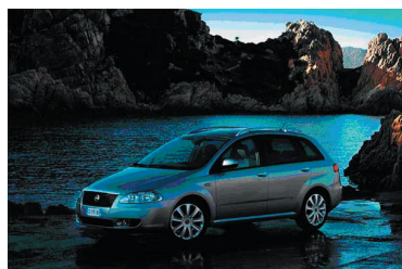
Fiat Croma - din nästa dragbil?