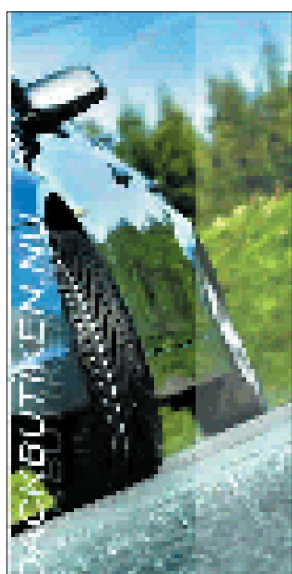
Däckbutiken.nu erbjuder alla medlemmar i SMV Club 10 % rabatt på alla däck.

Välkommen till Däckbutiken.nu - 10 % rabatt till alla SMV Clubmedlemmar på däck!