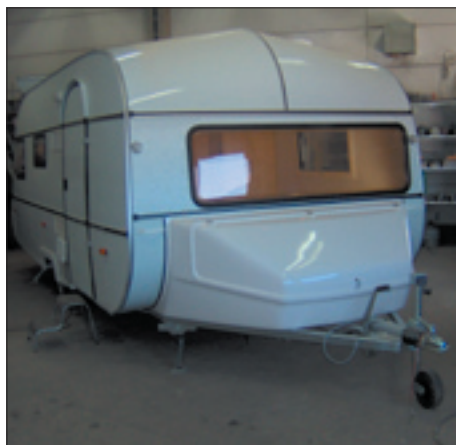
SMV 550 i fullbreddsmodell (2,50 bred). Just detta exemplar håller dessutom på att anpassas för funktionshindrade.

Bilder från fabriken under byggnationen av den anpassade fullbreddsmodellen.