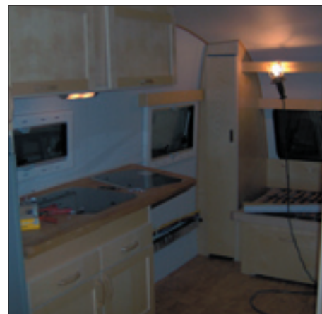
Interiören på den anpassade fullbreddsmodellen. Under diskbänken kommer man t ex inte att sätta in några skåp, så att man med en rullstol ska kunna åka ända intill.