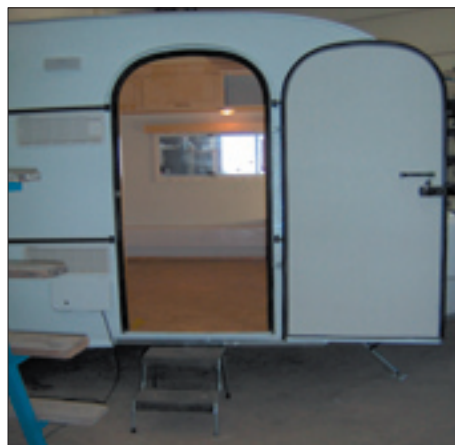
T ex bygger man dörren extra bred, dessutom ska den levereras med en ramp.