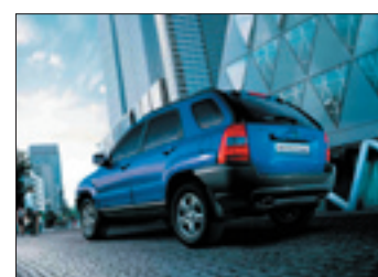
Din nästa dragbil?

Modellen Sportage finns från 192 900 kr.