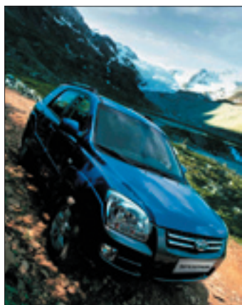
Sportage, som redan i standardutförande känns lyxig.

Kia gör ett återinträde i SUV-klassen med nya Sportage.