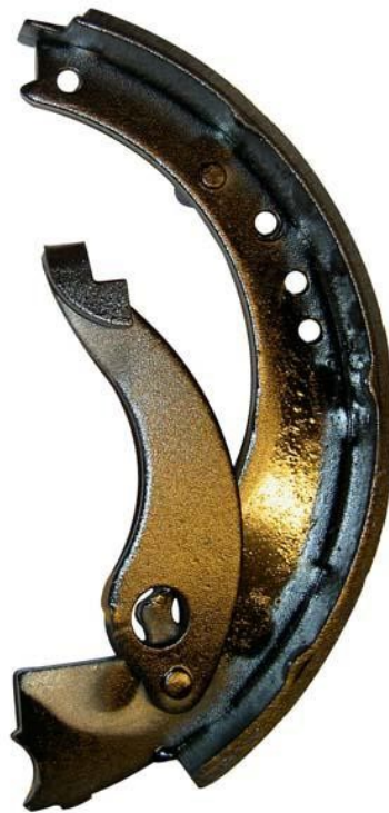
10107/H Bromsback 203x35 Bakre hävarm hö