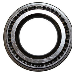
732 Lager 30207, Ø 35/72x18,25