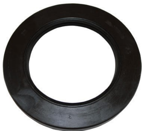
9714 Navtätning CB Ø 40/72x7