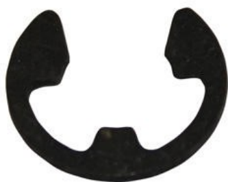
10131 Seegersäkring, för magnet