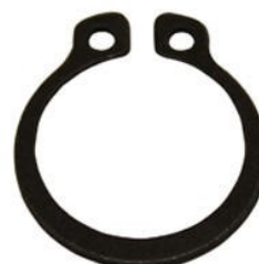
10133 Seegersäkring, backstyrning