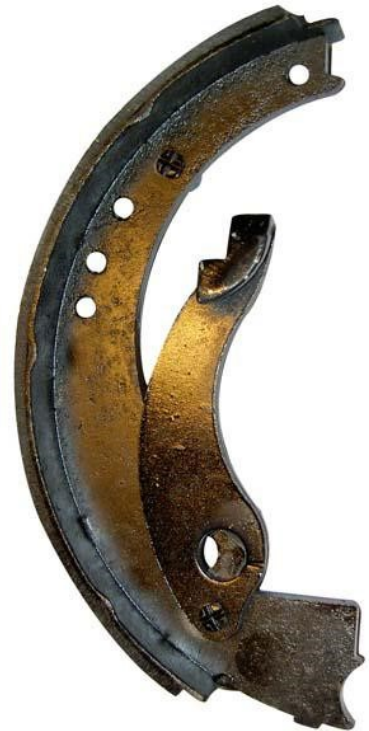
10107/V Bromsback 203x35 Bakre hävarm vä