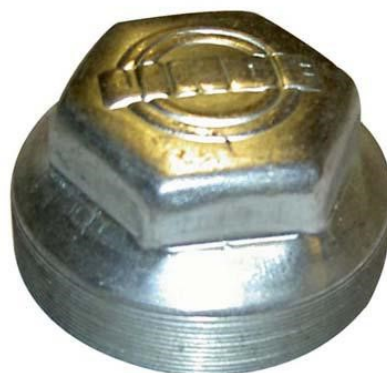
10145 Navkåpa Ø 53 mm, gängad, nav 21