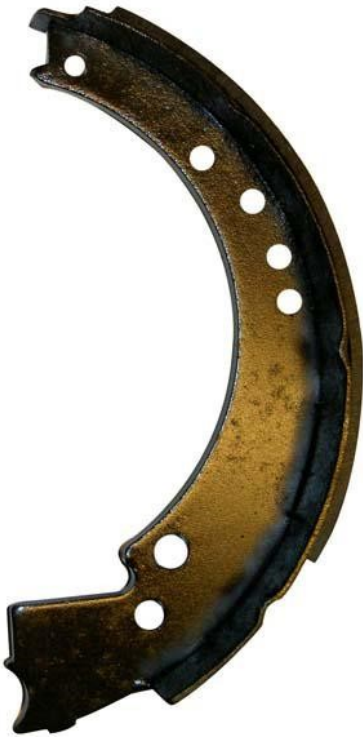
10106 Bromsback 203x35 Främre