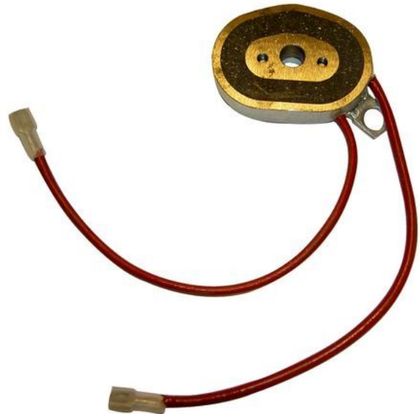
10019 Magnet 12V 203x35/45 vänster