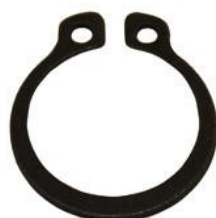
10132 Seegersäkring, för hävarm