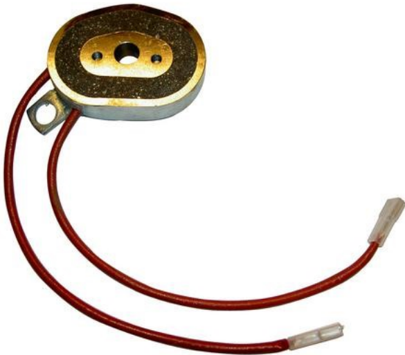
10018 Magnet 12V 203x35/45 höger