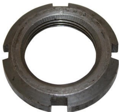
10135 Axelmutter KM5 ?