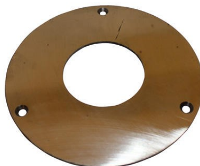
10119 Magnetplatta 203-broms