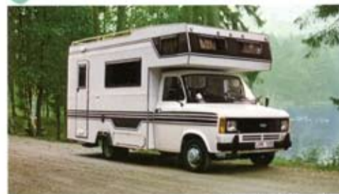
Kennil Campero är det nya, spännande och smidiga alternativet till traditionella husvagnar. En komplett husbil som

Du kör som vanligt, utan att behöva ta särskild hänsyn till 70-fart, där andra kan köra i 90, eller 110 km-fart. Kennil Campero är på vägen som en vanlig bil, stark, komfortabel och driftsäker. På camping- eller rastplatsen är den genast en komfortabel och välutrustad husvagn. Klar att ta i bruk, utan speciella parkerings- eller uppställningsbekymmer. Enklare kan det inte bli.